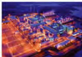
POWER & ENERGY